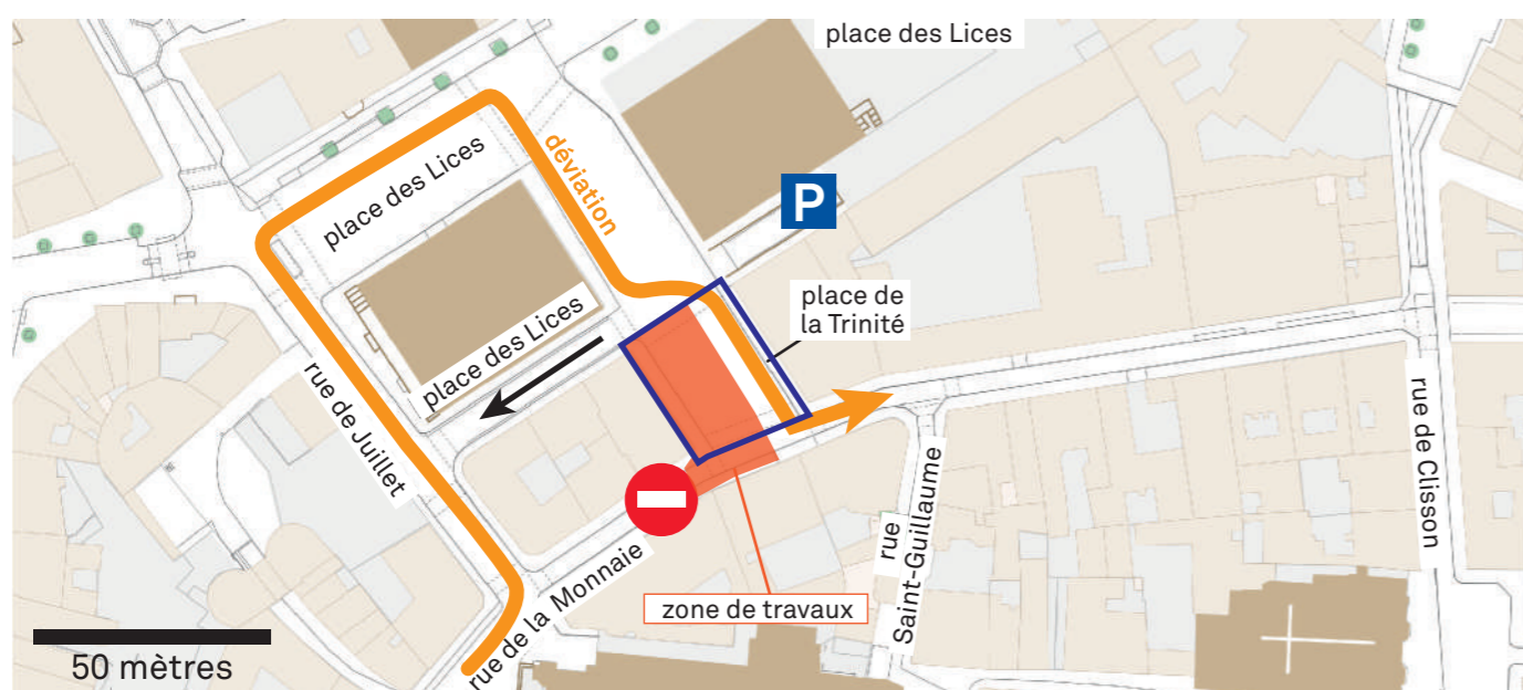
plan de circulation du 4 au 6 juillet