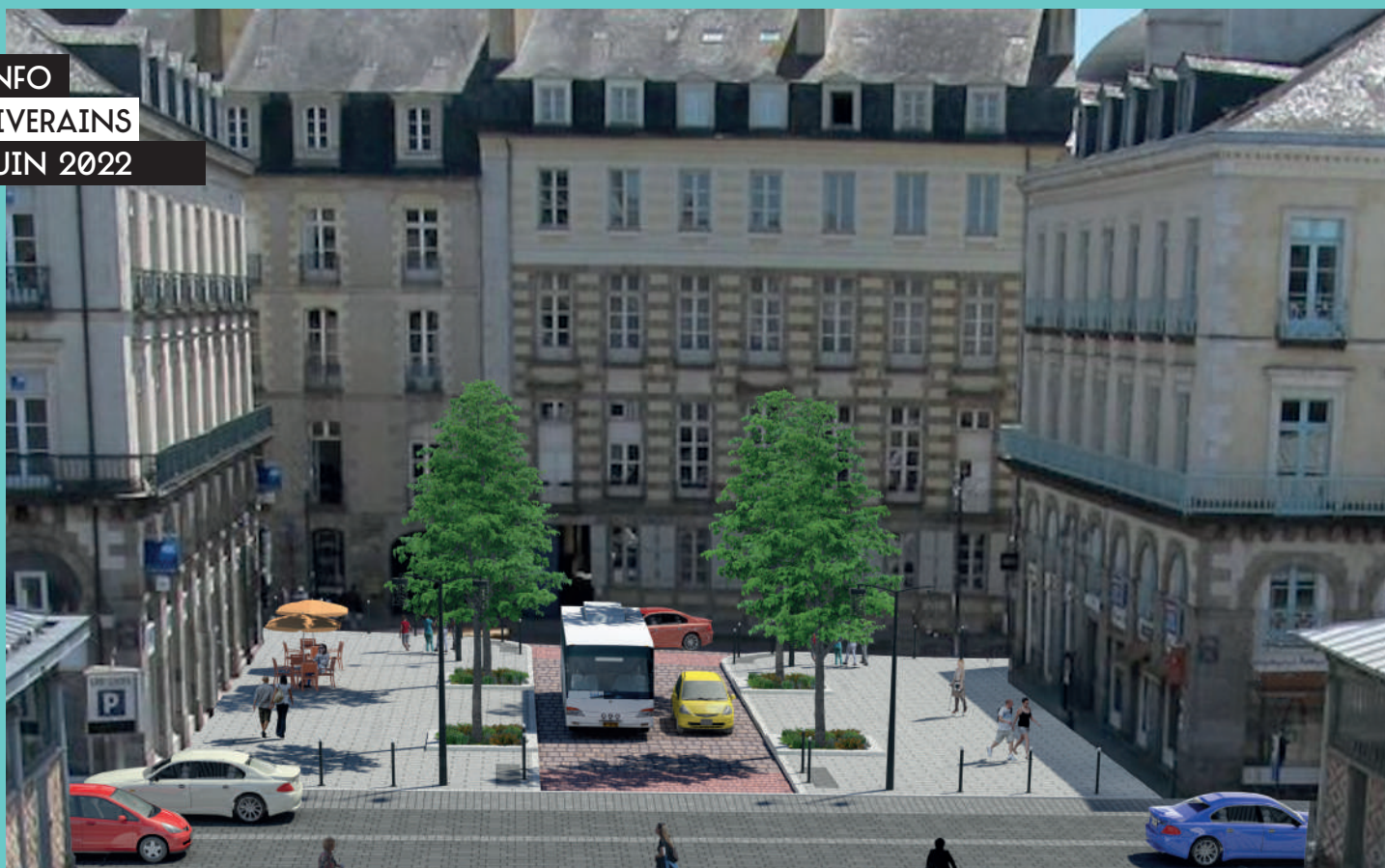
La future place de la Trinité