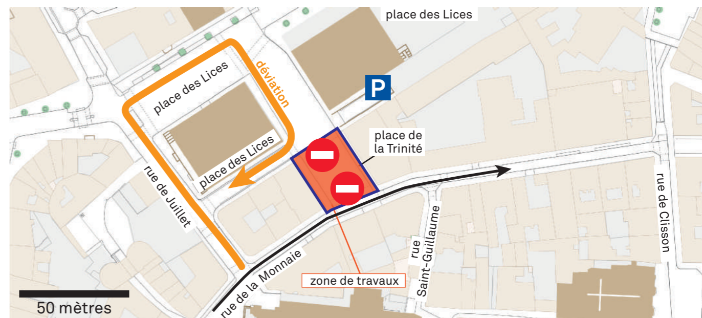
plan de circulation du 22 août au 18 novembre