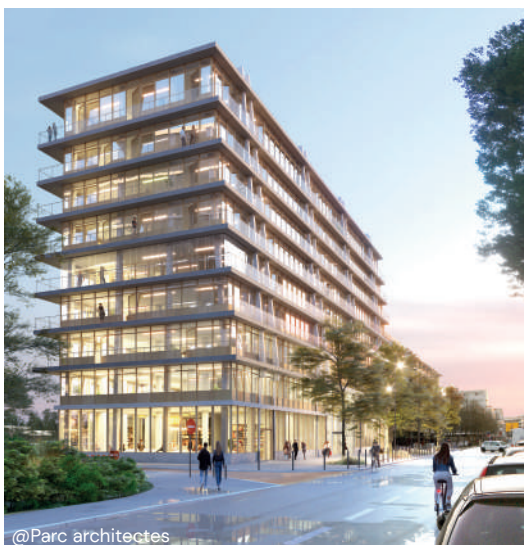
perspective du projet ADIM depuis le boulevard Solférino

La gare routière restera ouverte normalement pendant toute la durée des travaux.