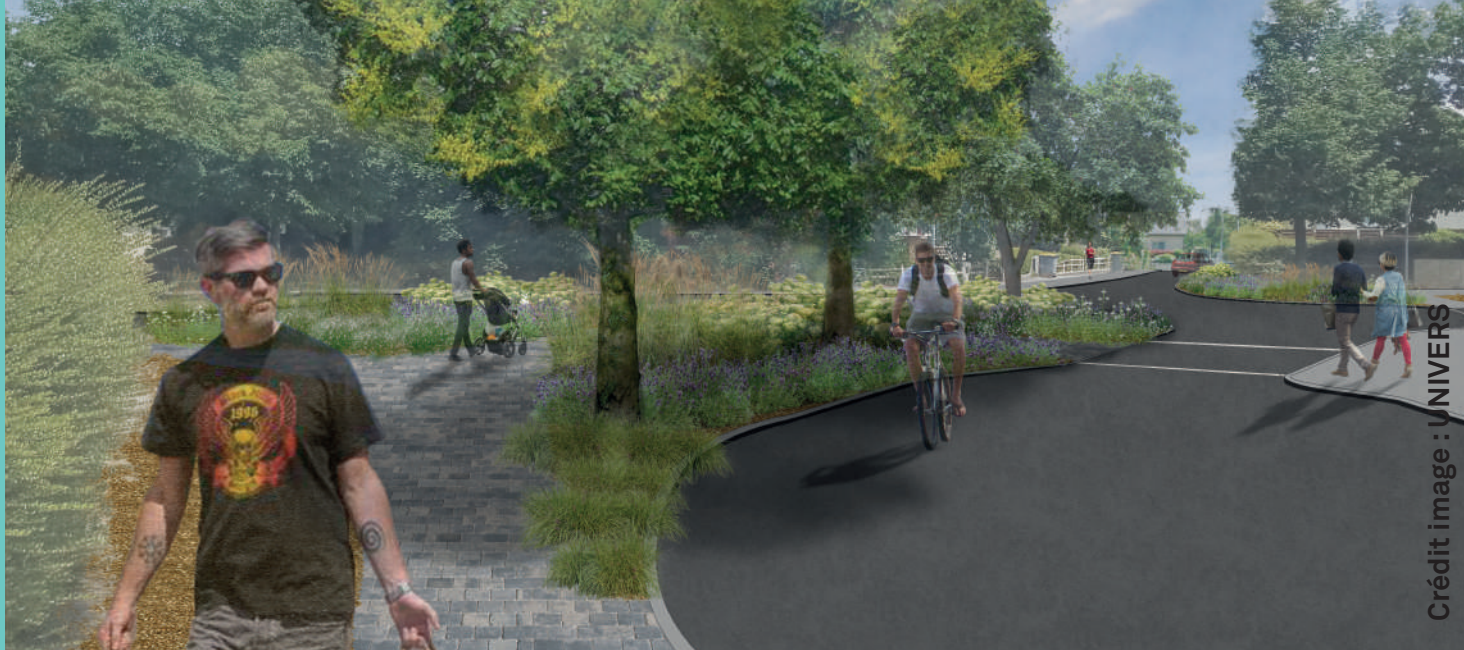
Vue depuis la rue des Tulipes

Rennes Métropole et la commune de Vezein-le-Coquet vont réaménager le carrefour giratoire à l'intersection de la rue des Roses, des Cyclamens, des Tulipes et du Muguet.