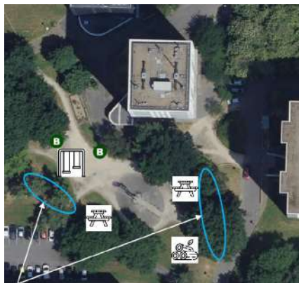
Ajout de plantations pour créer un écran végétal, une intimité