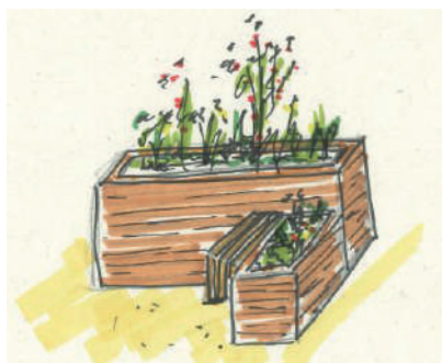
Exemple de jardinières, avec assise

Pour plus de renseignements sur le projet urbain, vous pouvez vous rendre aux permanences de la Maison du Projet : metropole.rennes.fr/quartier-le-blosne