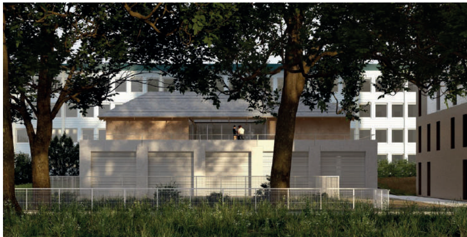
Vues depuis l'avenue de Pologne, façade ouest du bâtiment Perspectives : agence BRA architectes