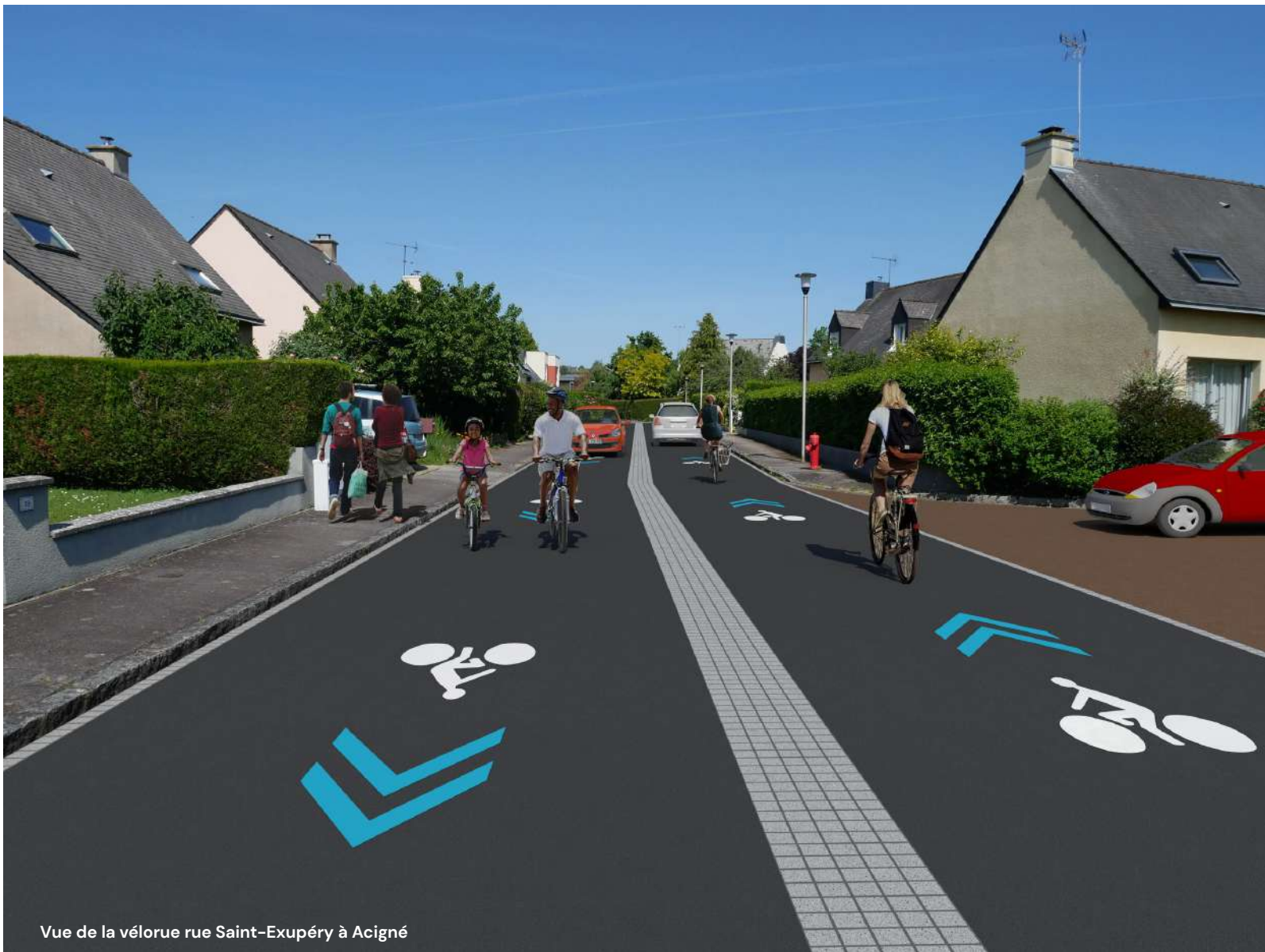
Vue de la vélorue rue Saint-Exupéry à Acigné