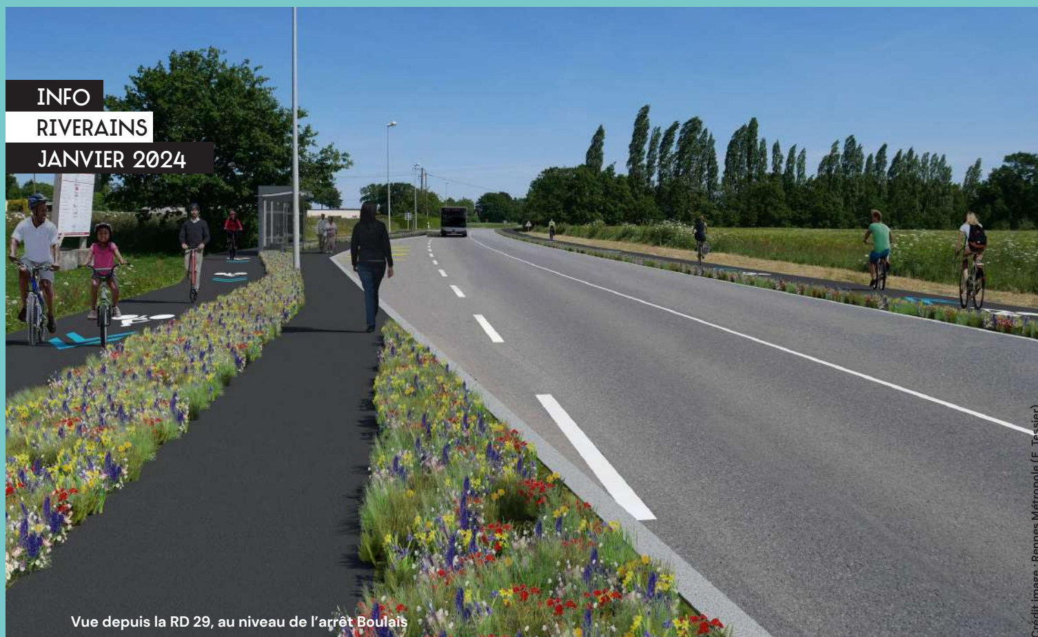
Vue depuis la RD 29, au niveau de l'arrêt Boulais