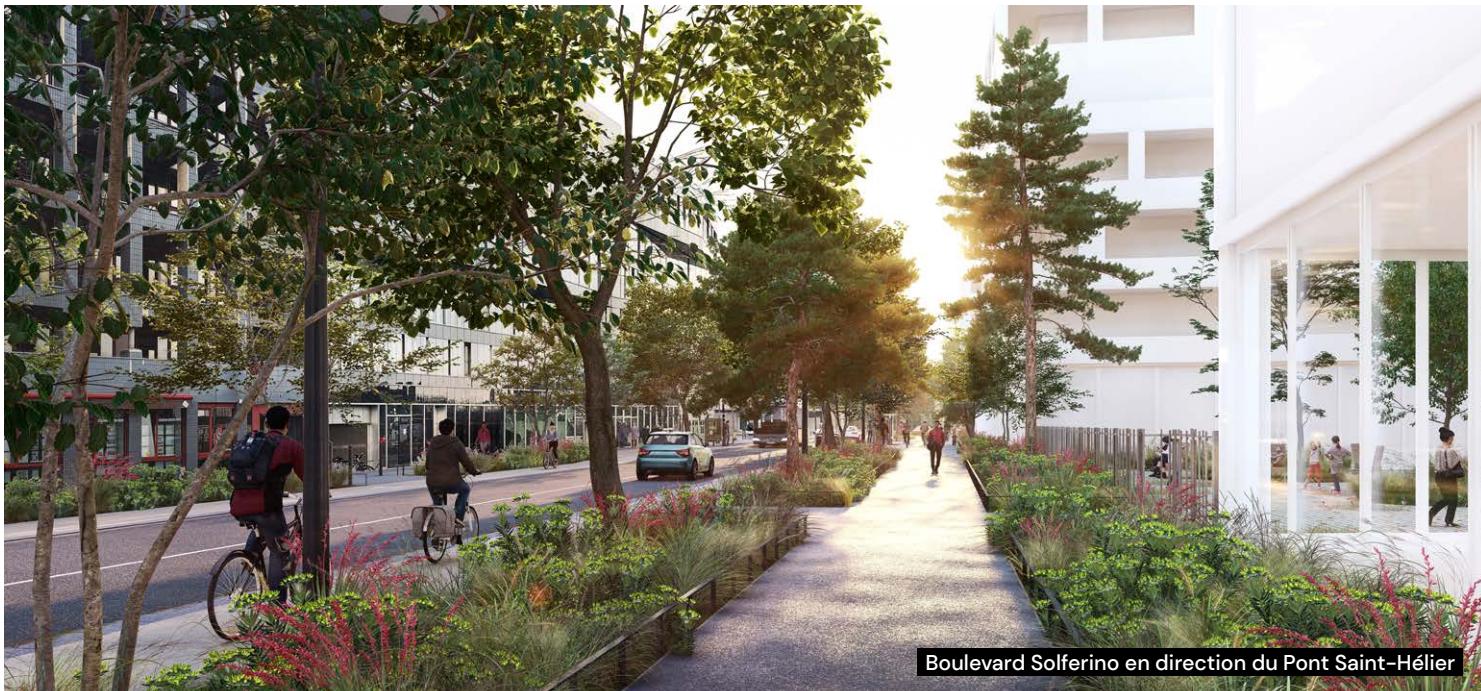
Boulevard Solferino en direction du Pont Saint-Hélier