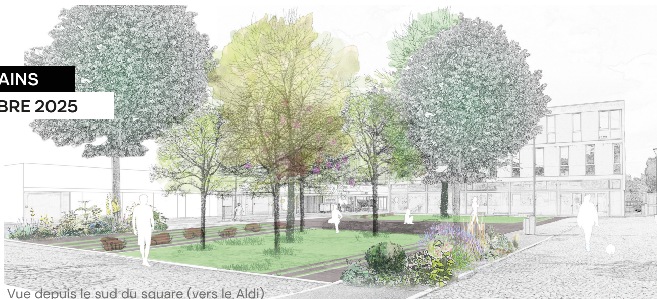
Vue depuis le sud du square (vers le Aldi)