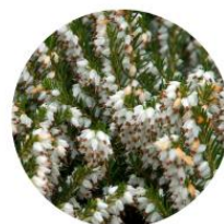
Erica x darleyensis Silberschmelze - Bruyère de Darley