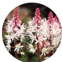
Tiarella Morning Star - Tiarelle hybride