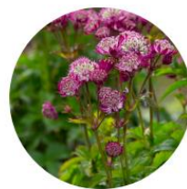
Astrantia major 'Star of Beauty' Grande astrance