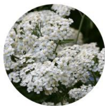
Achillea millefolium Schneetaler - Achillée millefeuille Schneetaler