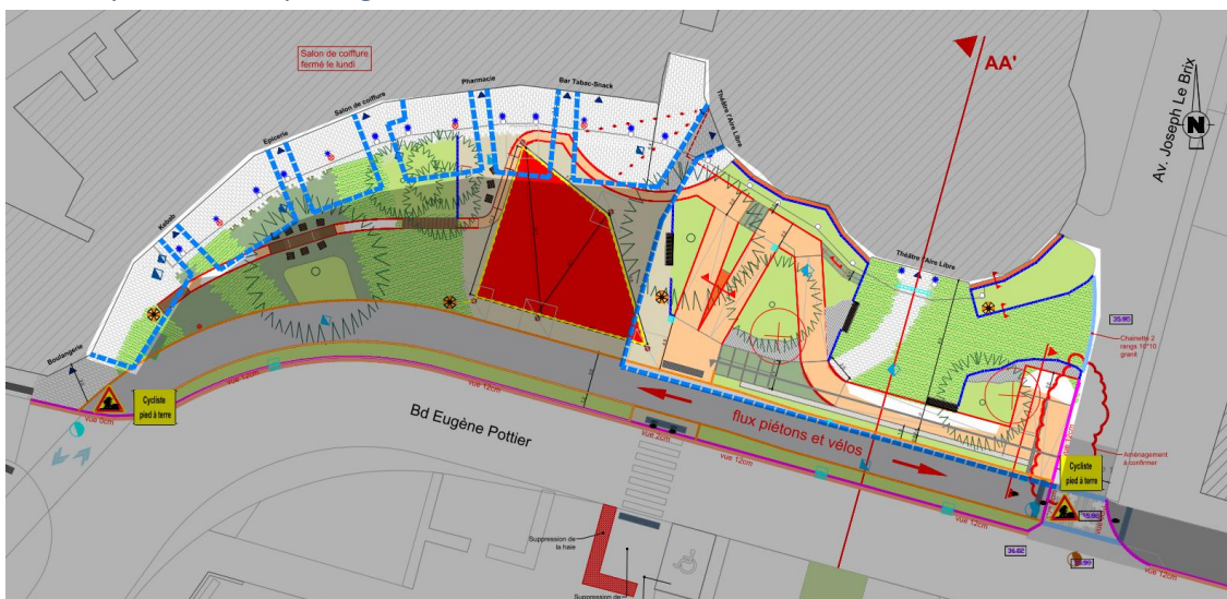
❖ Phase 03 : du 09 mars au 20 mars 2026

Les déplacements des engins de chantier s'effectueront majoritairement par la rue longeant le côté est de l'Aire Libre et emprunteront ponctuellement l'emprise du REV. Dans ces zones, les cyclistes sont invités à mettre pied à terre pour garantir la sécurité.