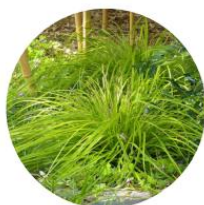
Carex oshimensis Everillo- Laiche d'Oshima, Carex japonais