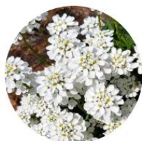
Iberis sempervirens - Corbeille d'argent