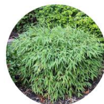
Fargesia murielae Elias - Bambou nain non traçant