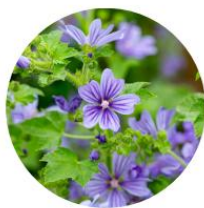
Malva sylvestris 'Primley Blue' - Mauve sylvestre