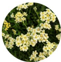
Achillea lewisii 'King Edward' - Achillée