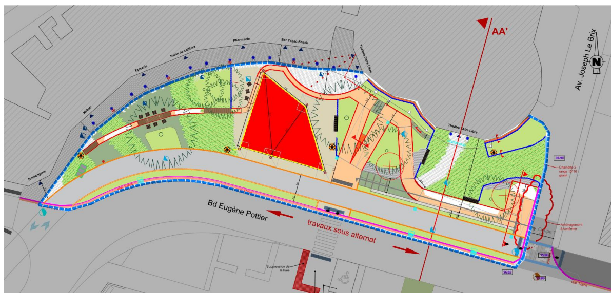
Phase 04 : avril 2026

Afin d'agrémenter les espaces verts dans l'attente des plantations définitives, une prairie fleurie sera semée.