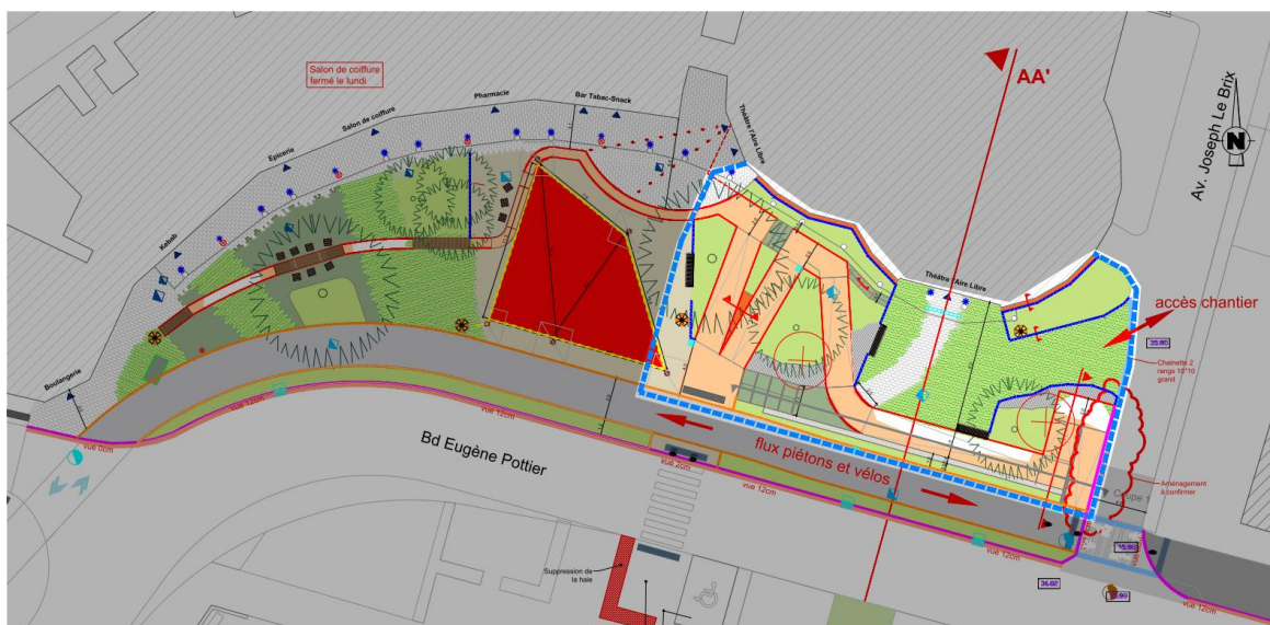
Phase 01 : janvier 2026

Le chantier se poursuivra sur la partie est de la place, avec la préparation des espaces verts (mise en place de la terre végétale) et la pose du pavage.