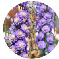
Delphinium Highlander Bolero - Pied d'alouette vivace, Dauphinelle