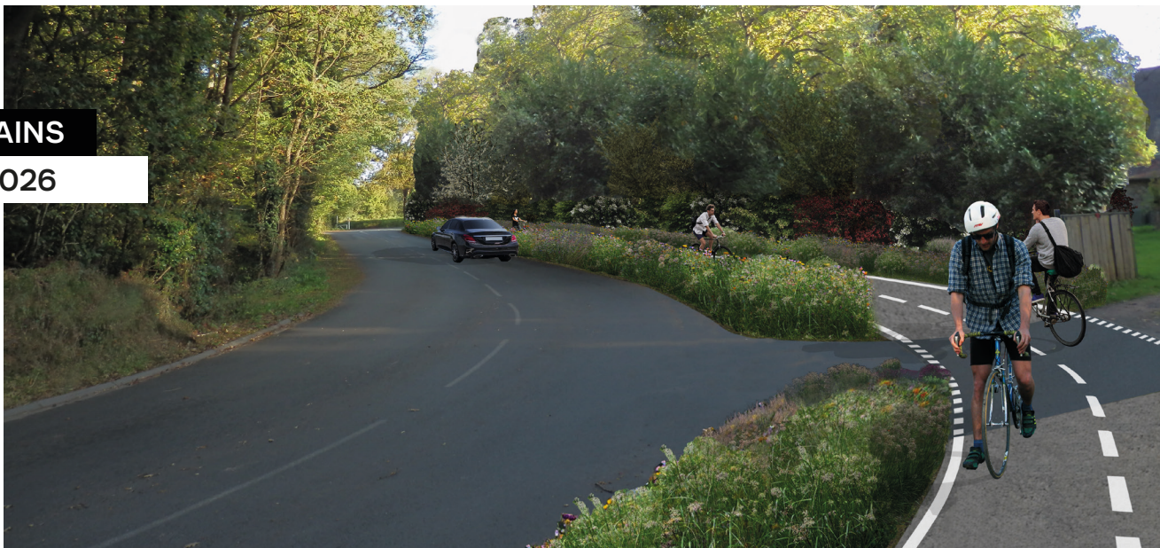
VC17, au niveau du lieu-dit Chaton